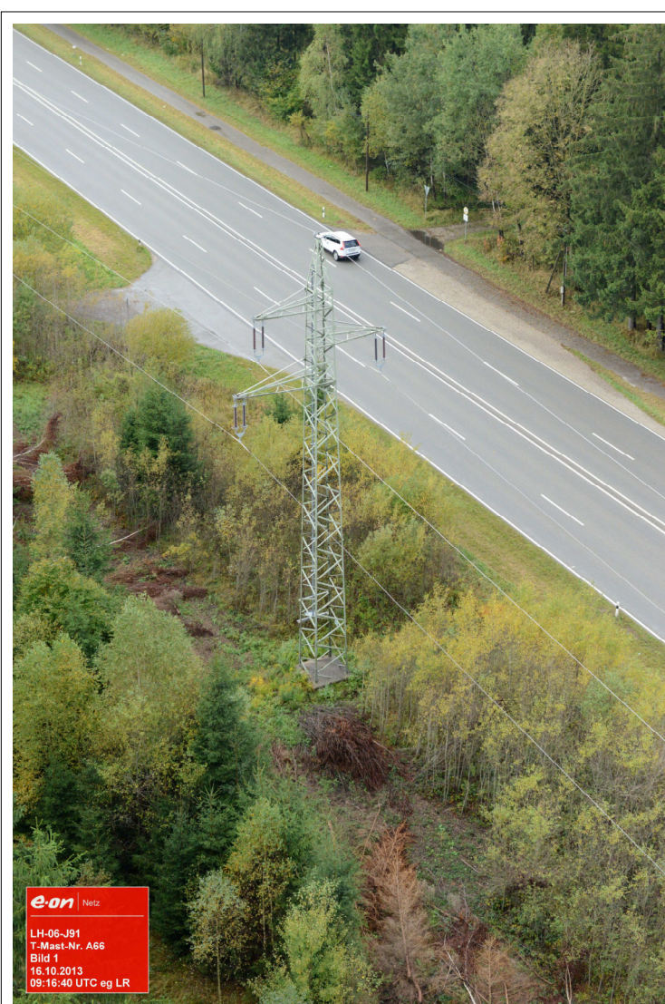
e-on Netz LH-06-J91 A-Mast-Nr. A66 Bild 1 16.10.2013 09:16:40 UTC eg LR