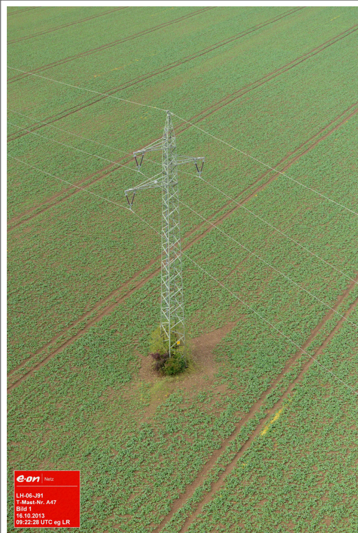
e-on Netz LH-06-J91 T-Mast-Nr. A47 Bild 1 16.10.2013 09:22:28 UTC eg LR