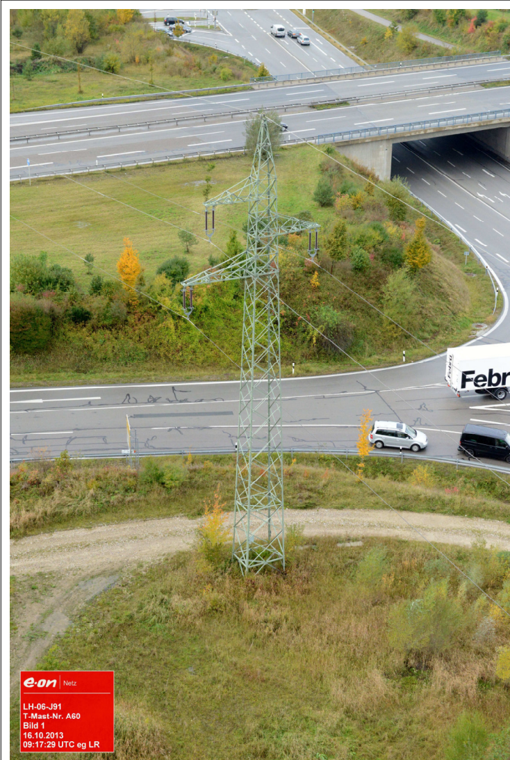
e-on Netz LH-06-J91 T-Mast-Nr. A60 Bild 1 16.10.2013 09:17:29 UTC eg LR