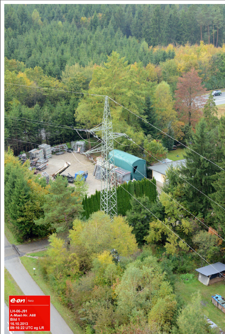
e-on Netz LH-06-J91 A-Mast-Nr. A68 Bild 1 16.10.2013 09:16:22 UTC eg LR