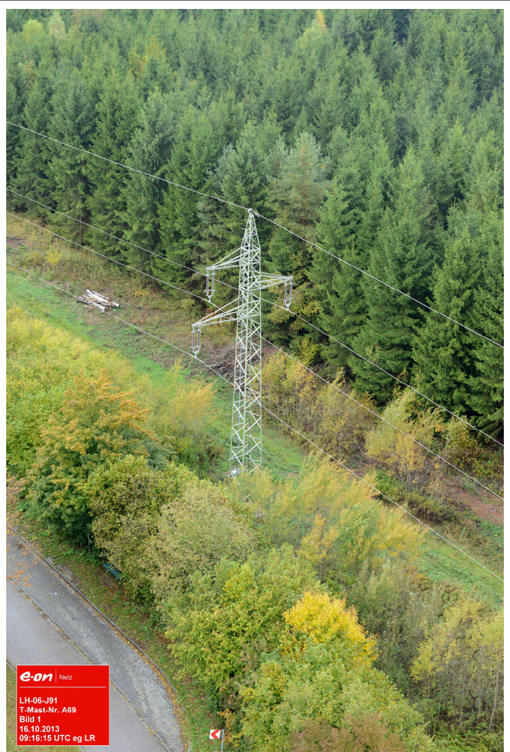
e-on Netz LH-06-J91 A-Mast-Nr. A69 Bild 1 16.10.2013 09:16:15 UTC eg LR