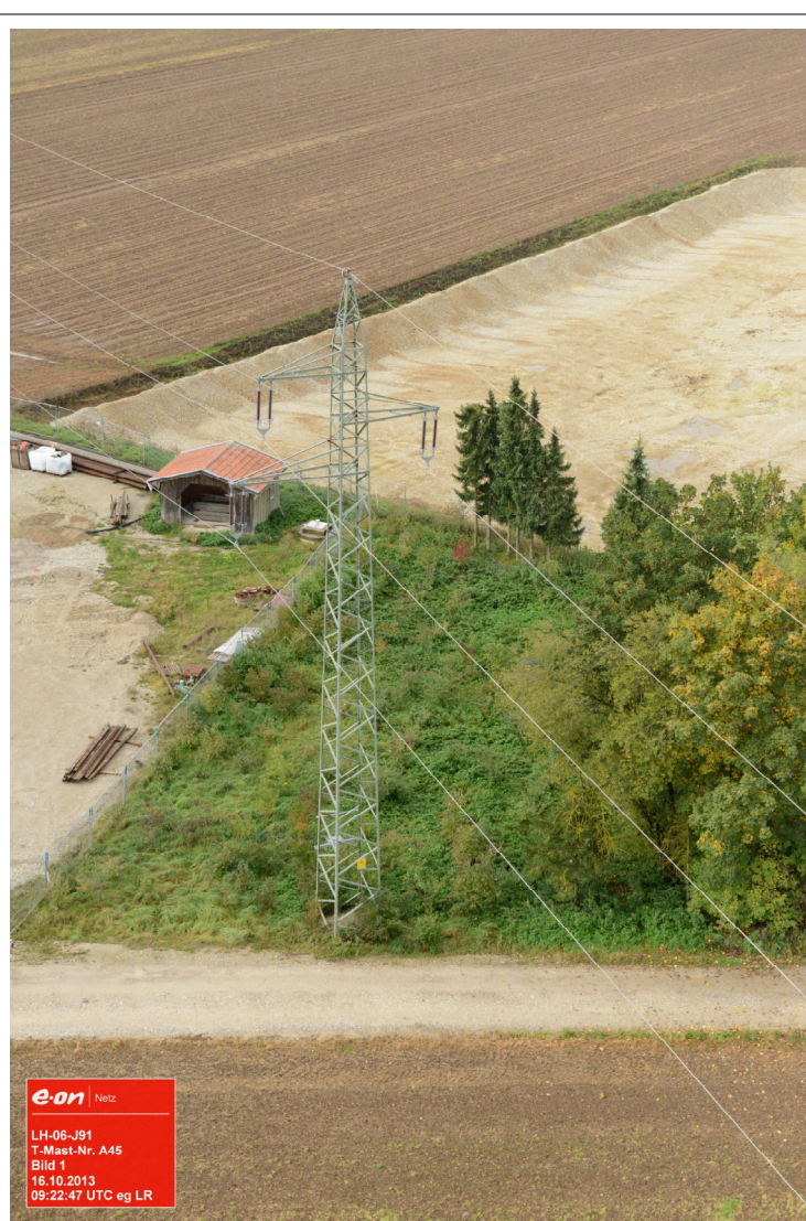
e-on Netz LH-06-J91 T-Mast-Nr. A45 Bild 1 16.10.2013 09:22:47 UTC eg LR