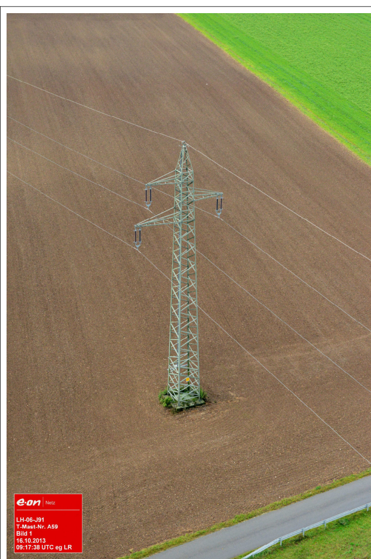
e-on Netz LH-06-J91 T-Mast-Nr. A59 Bild 1 16.10.2013 09:17:38 UTC eg LR