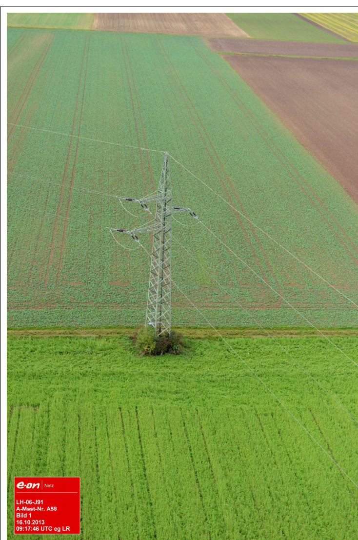
e-on Netz LH-06-J91 A-Mast-Nr. A58 Bild 1 16.10.2013 09:17:46 UTC eg LR