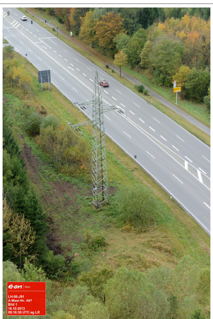
e-on Netz LH-06-J91 A-Mast-Nr. A67 Bild 1 16.10.2013 09:16:30 UTC eg LR