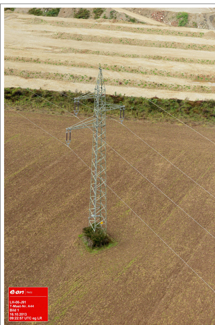
e-on Netz LH-06-J91 T-Mast-Nr. A44 Bild 1 16.10.2013 09:22:57 UTC eg LR