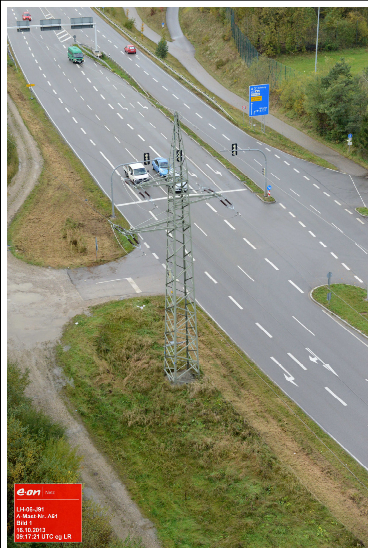
e-on Netz LH-06-J91 A-Mast-Nr. A61 Bild 1 16.10.2013 09:17:21 UTC eg LR