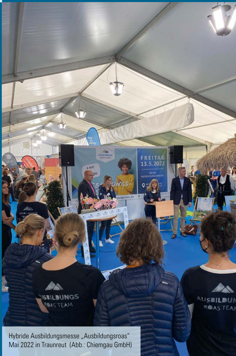
Hybride Ausbildungsmesse „Ausbildungsroas“ Mai 2022 in Traunreut