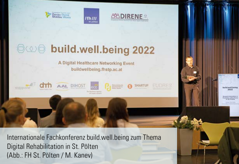
Internationale Fachkonferenz build.well.being zum Thema Digital Rehabilitation in St. Pölten