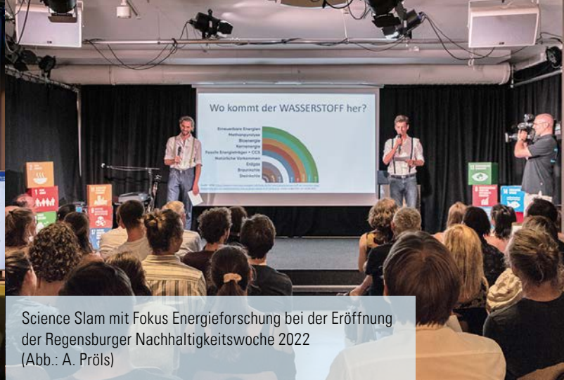
Science Slam mit Fokus Energieforschung bei der Eröffnung der Regensburger Nachhaltigkeitswoche 2022 (Abb.: A. Pröls)