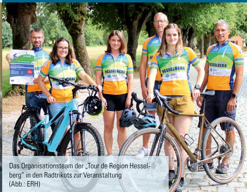
Das Organisationsteam der „Tour de Region Hesselberg“ in den Radtrikots zur Veranstaltung (Abb.: ERH)