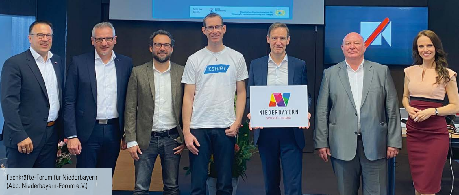
Fachkräfte-Forum für Niederbayern (Abb. Niederbayern-Forum e.V.)