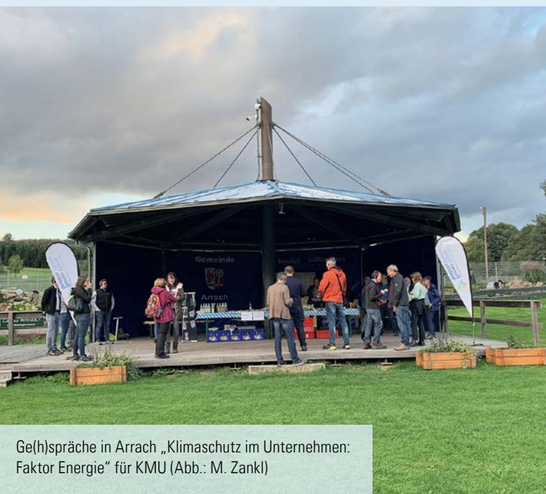
Ge(h)sprache in Arrach „Klimaschutz im Unternehmen: Faktor Energie“ für KMU (Abb.: M. Zankl)