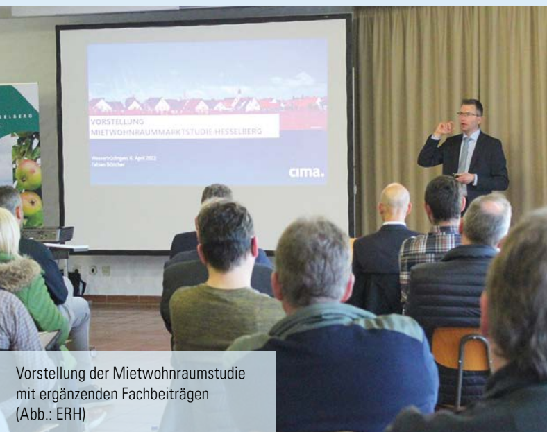
Vorstellung der Mietwohnraumstudie mit ergänzenden Fachbeiträgen (Abb.: ERH)