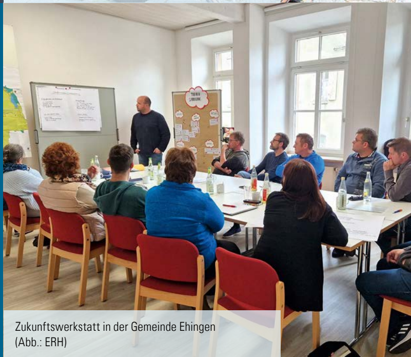
Zukunftswerkstatt in der Gemeinde Ehingen