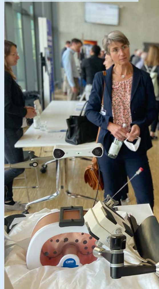
Netzwerken der reg. Gesundheitswirtschaft – Wirtschaftsraum Augsburg A 3 (Abb. Regio Augsburg Wirtschaft GmbH)