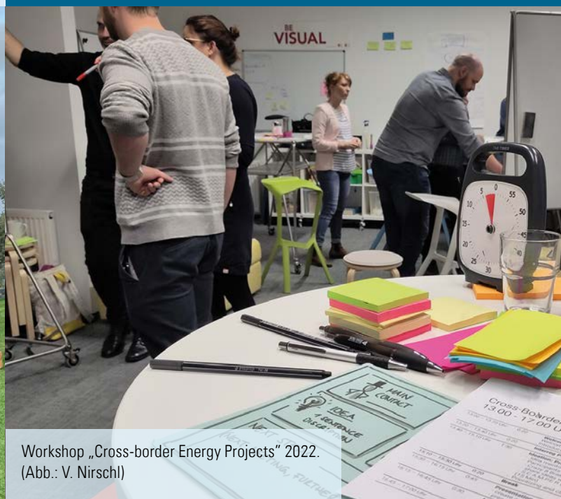
Workshop „Cross-border Energy Projects“ 2022. (Abb.: V. Nirschl)