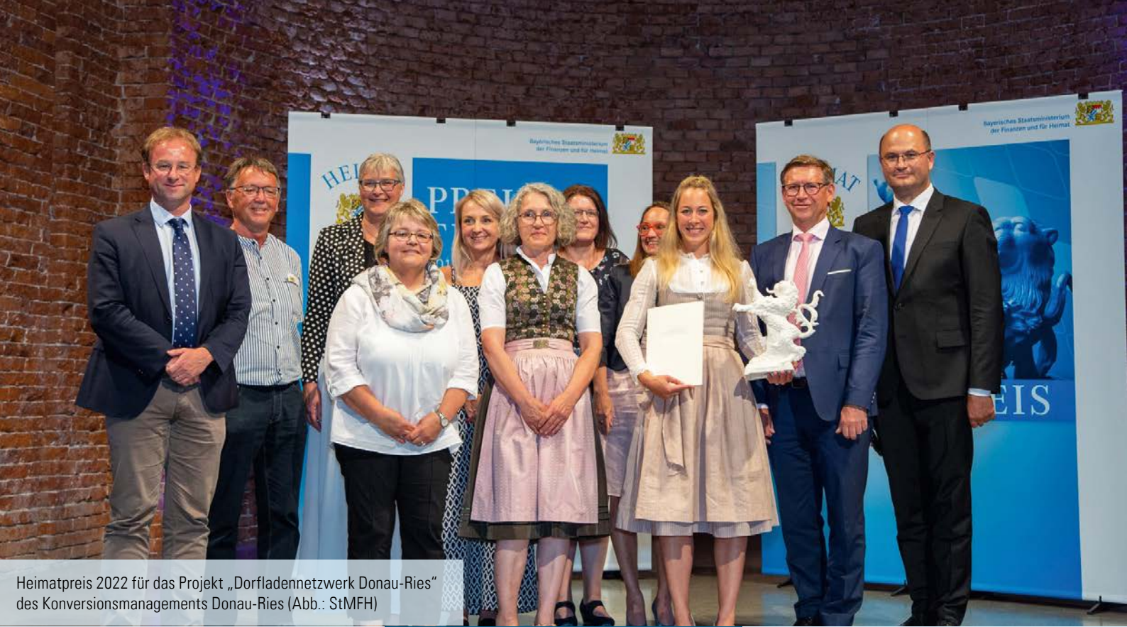
Heimatpreis 2022 für das Projekt „Dorfladennetzwerk Donau-Ries“ des Konversionsmanagements Donau-Ries