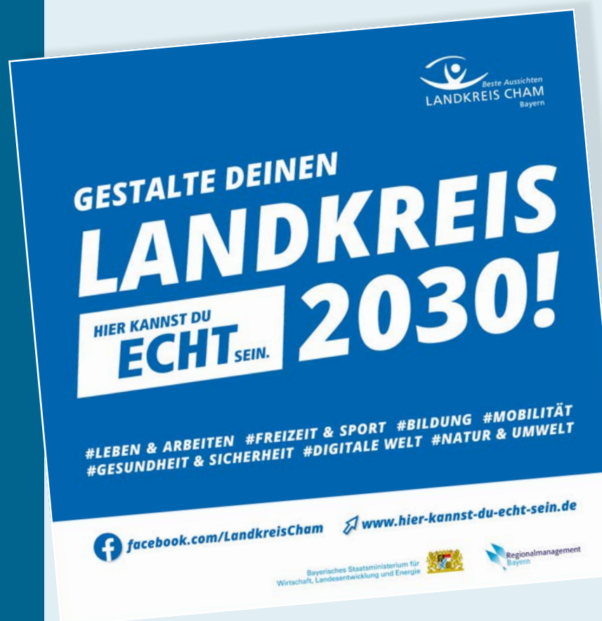
Veranstaltungsreihe „Dein Landkreis 2030!“